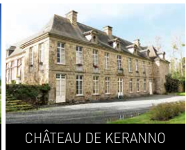
CHÂTEAU DE KERANNO