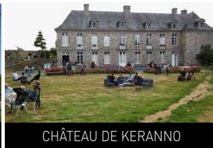
CHÂTEAU DE KERANNO