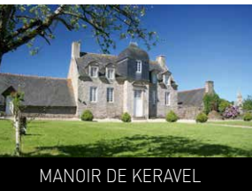
MANOIR DE KRAVEL